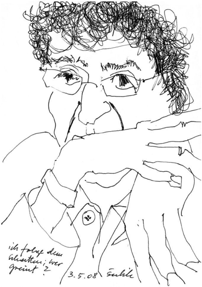
Zeichnung von Christof Šubik